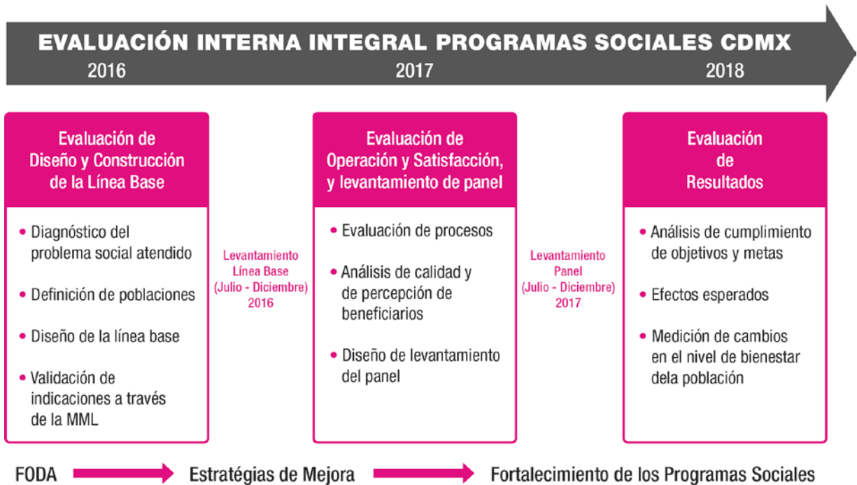
Figura 1. Evaluación Interna Integral de los Programas Sociales de la Ciudad de México 2016-2018

De esta forma, en 2016 se inició la PRIMERA ETAPA de la Evaluación Integral de los Programas Sociales de la CDMX, enmarcada en la Metodología de Marco Lógico, con la Evaluación de Diseño y Construcción de la Línea Base , que comprendió el análisis de la justificación inicial del programa, es decir, el diagnóstico del problema social atendido y la forma en que estos elementos de diagnóstico han evolucionado y lo han influido o afectado, es decir, cómo el diseño responde o se adapta a cambios en la situación inicial; el análisis de la población afectada por la problemática y la capacidad de atención del programa social; el análisis del ordenamiento y consistencia del programa, examinando sus objetivos generales y/o