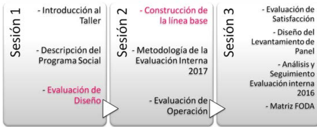
Figura 2. Contenidos Generales de la Sesiones del Taller para la Elaboración de las Evaluaciones Internas 2017 de los Programas Sociales de la CDMX